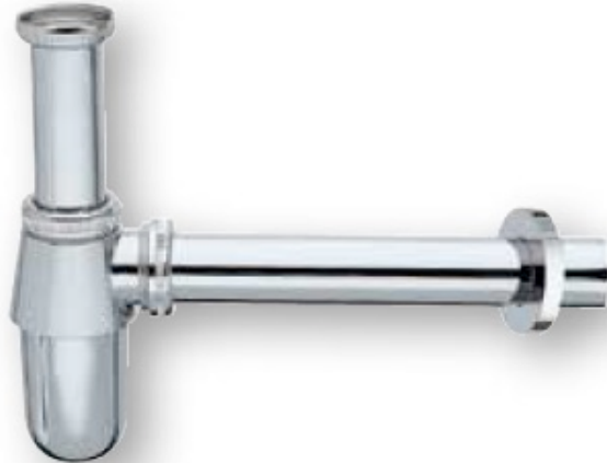
Sifón Botella Mod. 90.0007CR